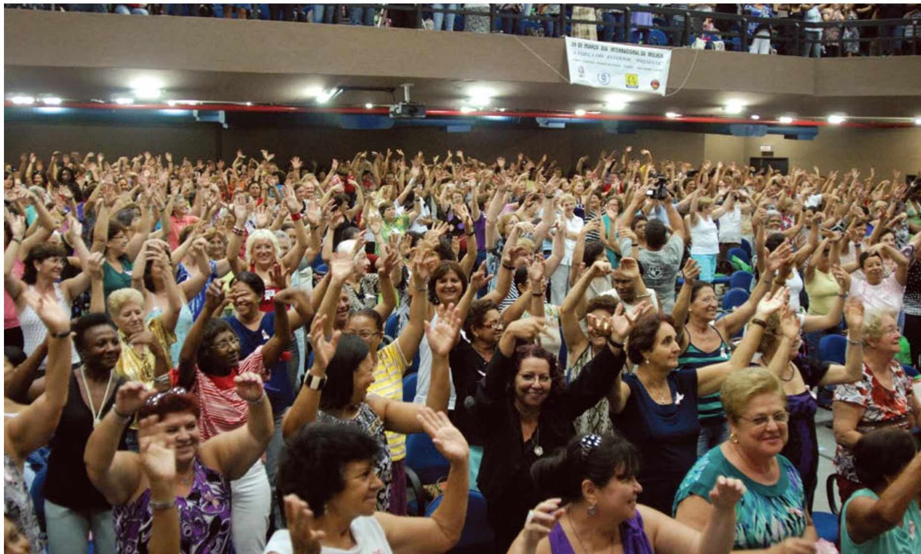
Mulheres se animam com dinâmica proposta durante a comemoração do Dia Internacional da Mulher do Sintetel.