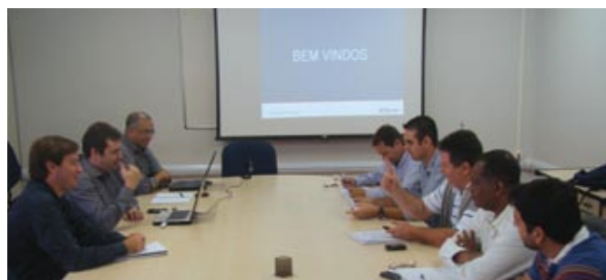
Reunião ocorrida no dia 3 de maio, no Sintetel, para discutir a PPR/2009.

Na contramão da Atento, as outras empresas de teleatendimento ainda não pagaram a PLR. O Sintetel enviou carta reivindicando o cumprimento da cláusula 5ª da Convenção Coletiva que prevê o pagamento da Participação nos Lucros e Resultados. Fazem parte deste grupo Contax, Mobitel, Tivit, entre outras. Acompanhe também as notícias pelo site www.sinetel.org ■