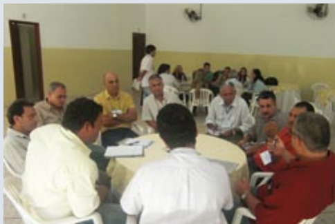
Diretores de base e delegados sindicais reuniram-se em grupos

Aconteceu no dia 10 de abril, na cidade de Bauru, mais uma edição do Seminário de Orientação e Conscientização Sindical/Política. Além da subse-de anfitriã, o evento contou com a participação de sindicalistas das regionais de Ribeirão Preto e São José do Rio Preto.