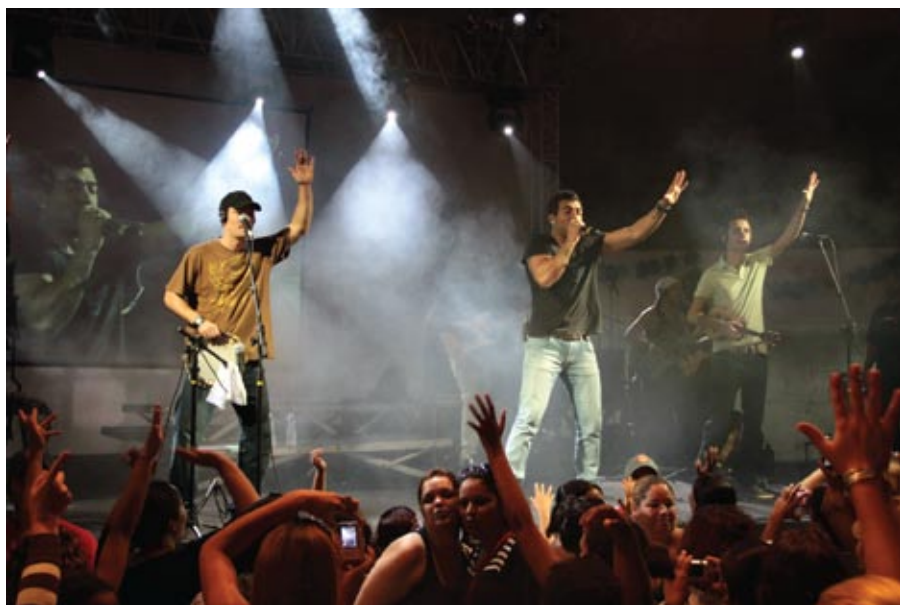
Grupo Nuwance levantou a galera com seu animado pagode

“Nós lutamos pelas 40 horas semanais, pelo fim do fator previdenciário, pelos fundos de pensão e pela a volta da aposentadoria especial para as telefonistas, conquista que nos foi tirada e que vamos resgatar”.