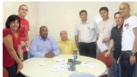
Comissão eleitoral reunida com trabalhadores que concorrem na eleição.