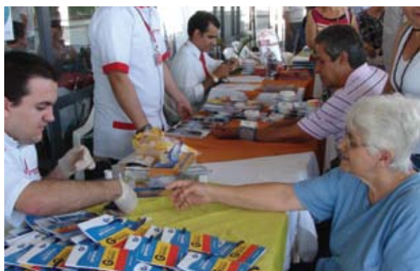
Aposentados fazem exames para diagnosticar diabetes.