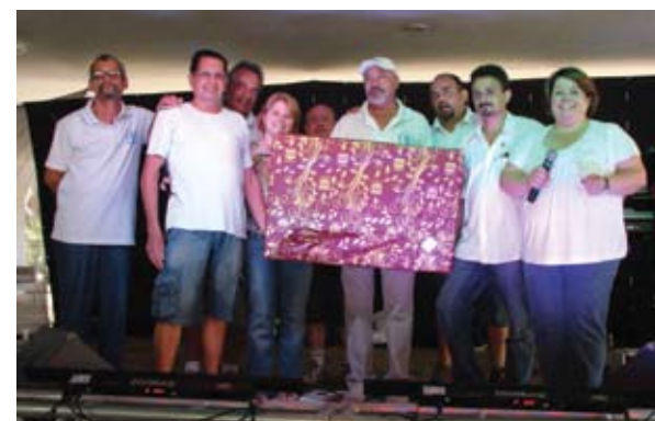
Acompanhados por membros da diretoria, aposentados recebem prêmios do sorteio.