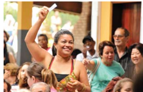
Entre os brindes sorteados, uma moderna televisão.