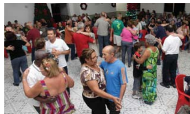
Ficar parado, nem pensar. A dança é uma terapia