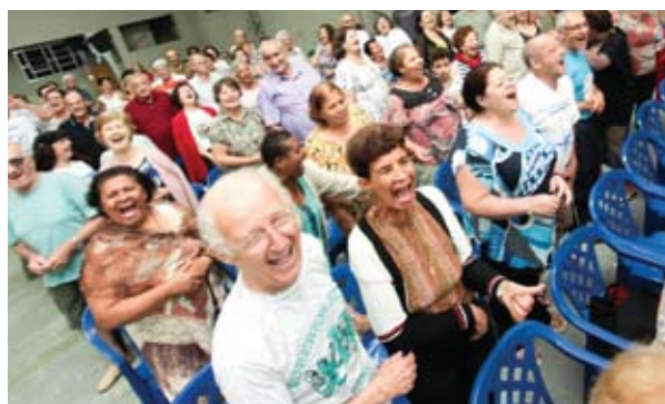
Rir é o melhor remédio. Descontração com muita alegria

Além das diversas atividades, o Centro de Convívio dos Aposentados também organizou um passeio até a praia de Mococa, uma das mais bonitas da região. Lá todos passaram um agradável dia de lazer com muita alegria e descontração. ■