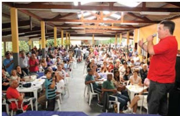
Mauro citou aposentados que viajaram até 700 km para ver os colegas.

A ABET (Associação Beneficente dos Empregados em Telecom) também marcou sua presença no evento como acontece todos os anos. ■