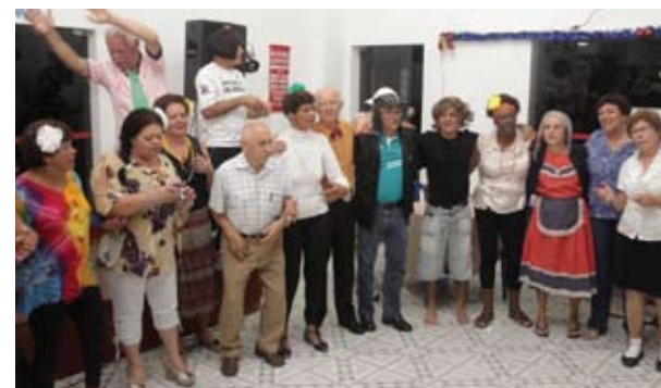
Encenação teatral revelou diversos artistas da categoria