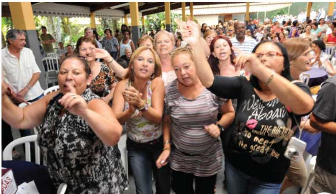
Cerca de mil aposentados das regiões do ABC, Baixada Santista, Vale do Ribeira, Alto Tietê e Capital compareceram ao IX Seminário