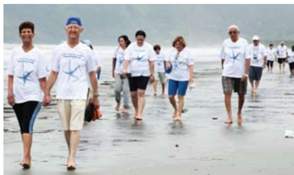
Tradicional caminhada até a colônia Caraguá II para um farto café da manhã