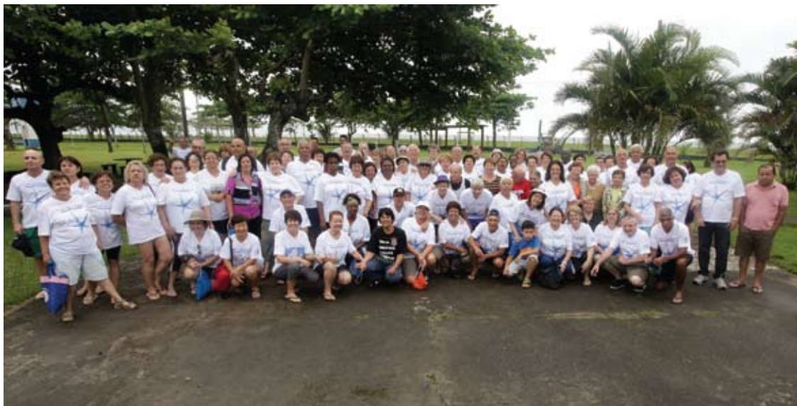
União, amizade e diversão marcaram o XIII Encontro dos Aposentados em Caraguá

Encontro em Caraguá e Seminário realizado em São Bernardo do Campo encerraram as atividades com grande participação dos aposentados. Pág. 3