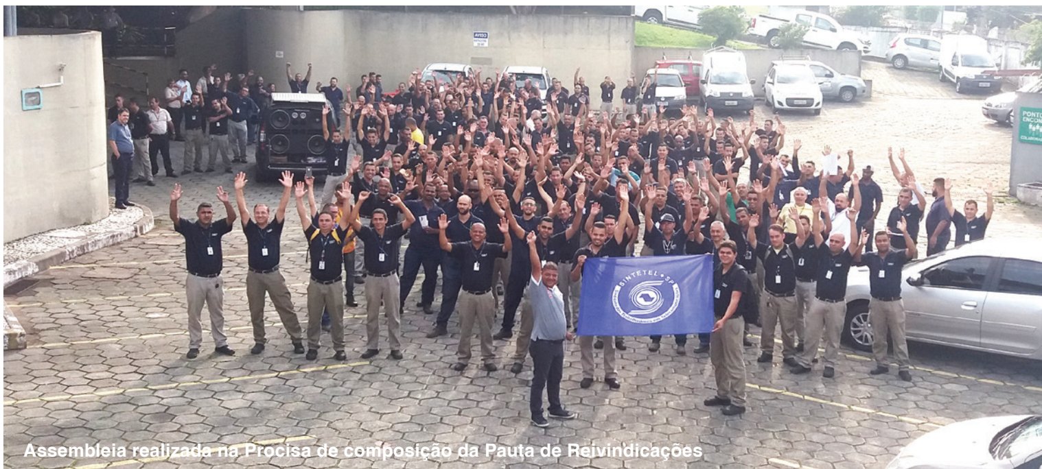
Assembleia realizada na Procisa de composição da Pauta de Reivindicações

O início da Campanha Salarial mostra que as empresas vão jogar duro. Entregamos a Pauta de Reivindicações em 1º de fevereiro, meses antes do início da data-base. Mas as empresas enrolaram. Só agora elas aceitaram negociar e marcaram uma reunião para 18/04/2018.