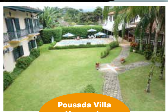
Pousada Villa Harmonia Parati - RJ