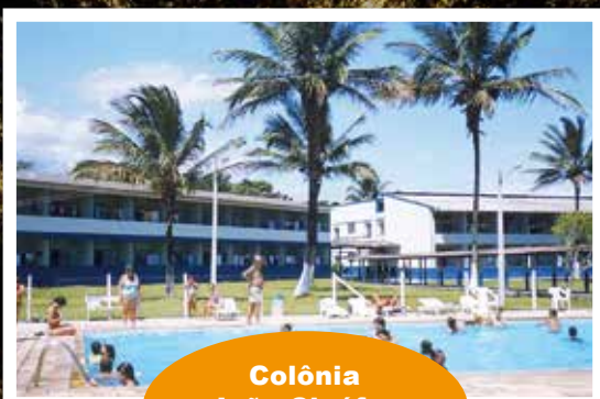
Colônia João Cleófas Caraguatatuba-SP