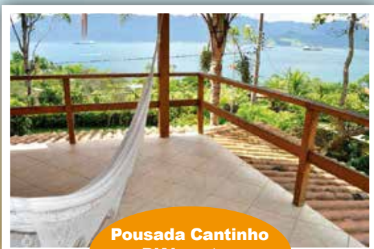
Pousada Cantinho D'Abrantes Ilha Bela-SP