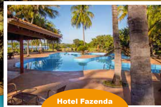
Hotel Fazenda Foz do Marinheiro Cardoso-SP