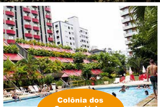
Colônia dos Comerciantes Praia Grande - SP

Sócios do Sintetel têm descontos especiais para curtir as férias nas Colônias do Sintetel e nos hotéis parceiros. Acesse o nosso site e veja os detalhes das Colônias, hotéis e pousadas disponíveis.