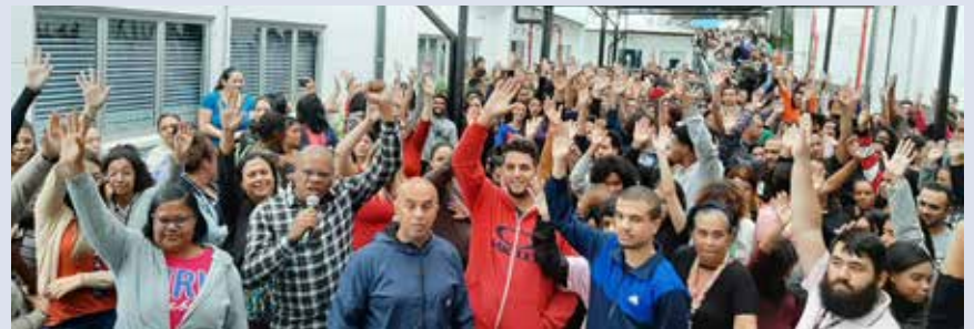
ATENTO – São Bernardo