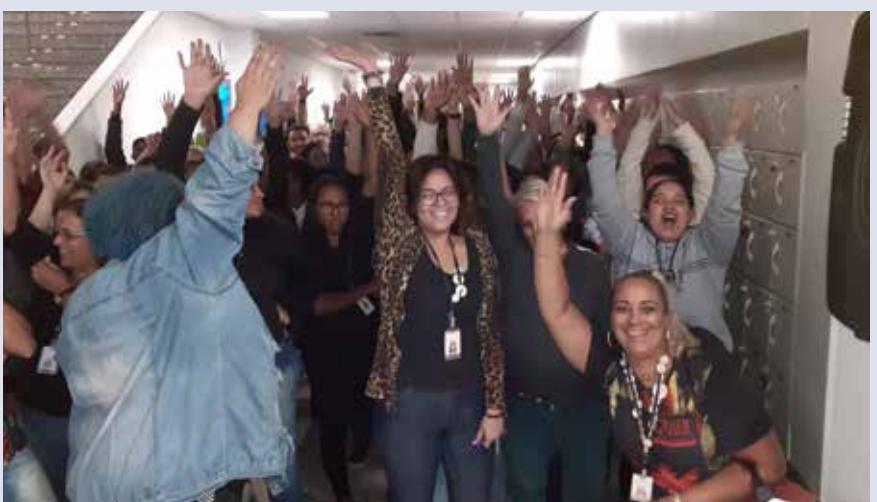
ATENTO – Santos

IMPORTANTE: O Sindicato realizou 36 assembleias. Porém, por uma questão de espaço só foi possível publicar oito imagens.