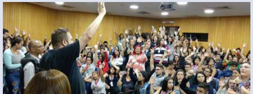
ATENTO – Guarulhos