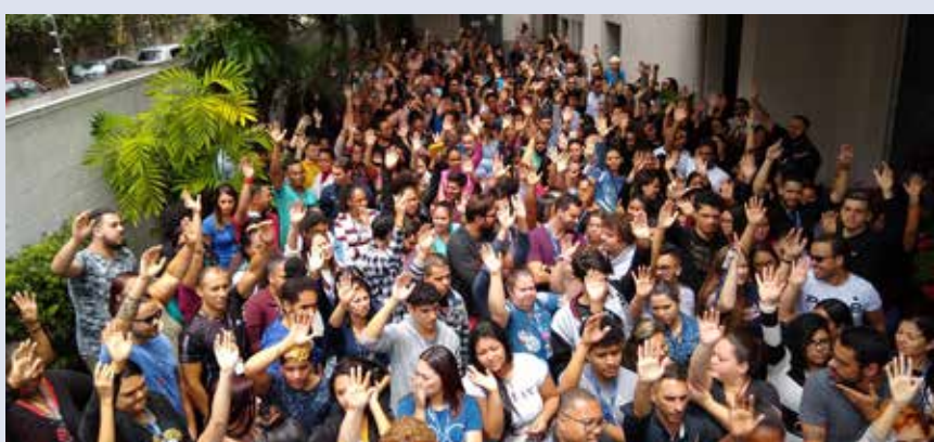
ATENTO – Zona Sul