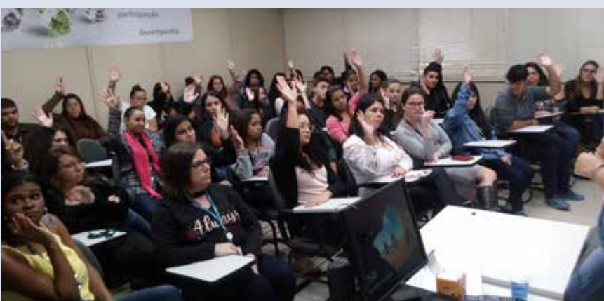
FIDELITY – Jundiaí