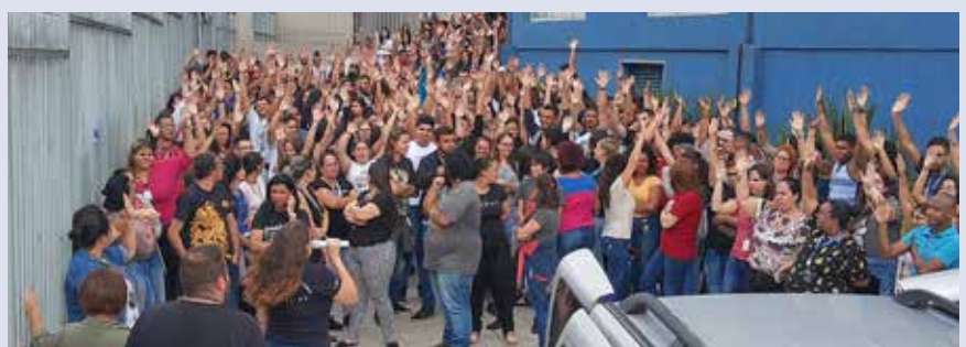
ATENTO – Guarulhos