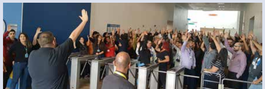
ATENTO – Itaquera